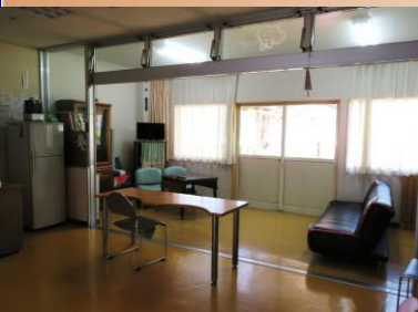
食堂（ショート部位）