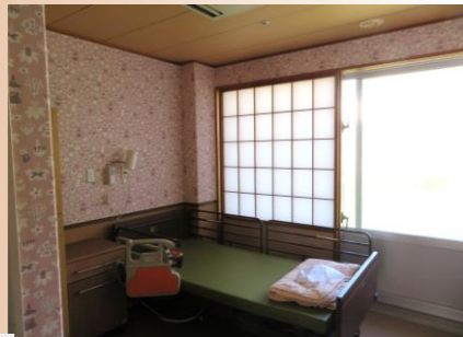
個室（洗面・トイレ付）